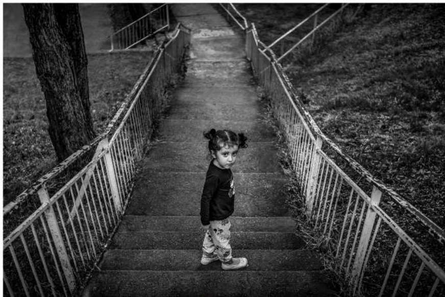
BISERA IN LABYRINTH