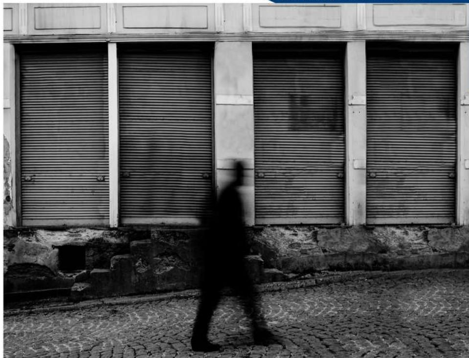
SHADOWS AND LIGHT

Во моментот, тој е одговорен за Фото клубот MOTUS, кој делува во рамките на Здружението за промоција на интелектуални, мултикултурни и спортски вредности MOTUS од Куманово, Северна Македонија.